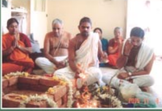
ஸ்ரீ ஹரி: வேதபாடசாலை துவக்கம் இடம் : ஸ்ரீ ஸாந்தீபளி குருகுல சேவா டிரஸ்ட். (A.P). ஹைதராபாத். தேதி : 08.11.2005