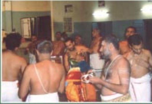
ஸ்ரீ துளசி கல்யாணம் இடம் : மதுராபுரி, தேதி : 13.11.2005